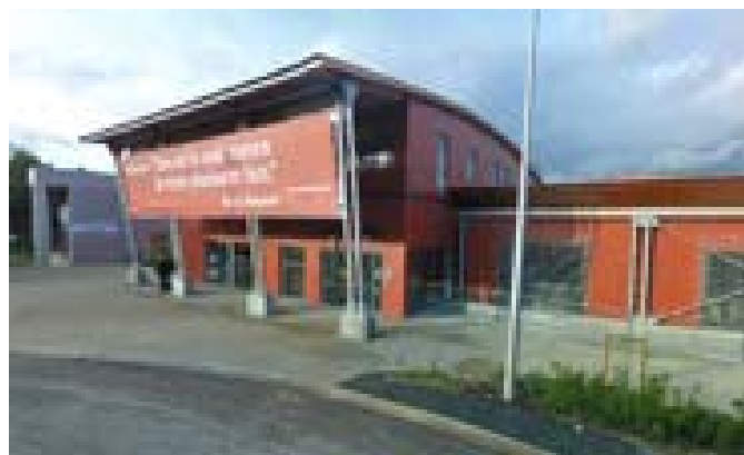
Médiathèque côté rue