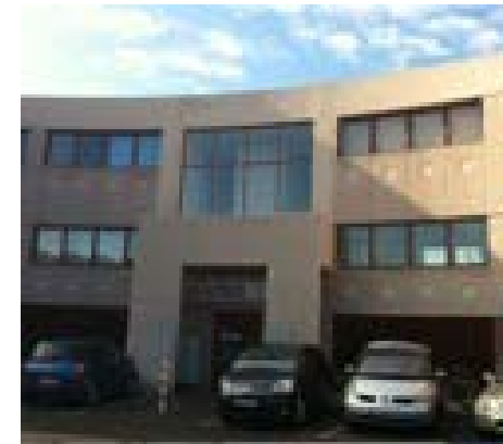
L'arrière du Centre