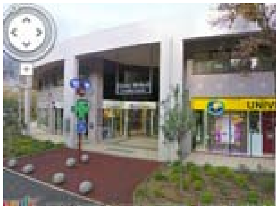
Centre Médical côté rue